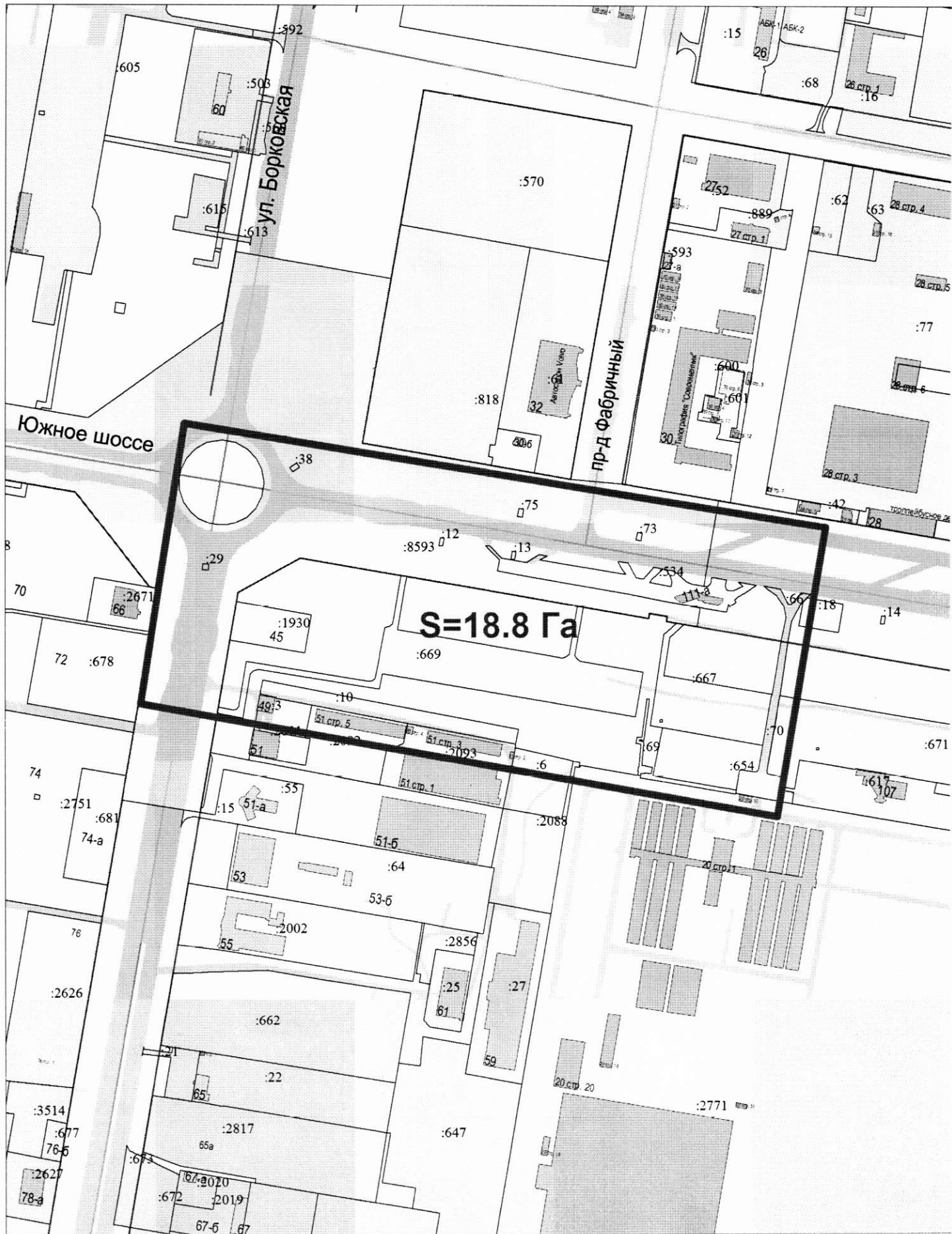
Схема территории проектирования № 2584-17/1

Приложение 1 к постановлению от 15.08.2016