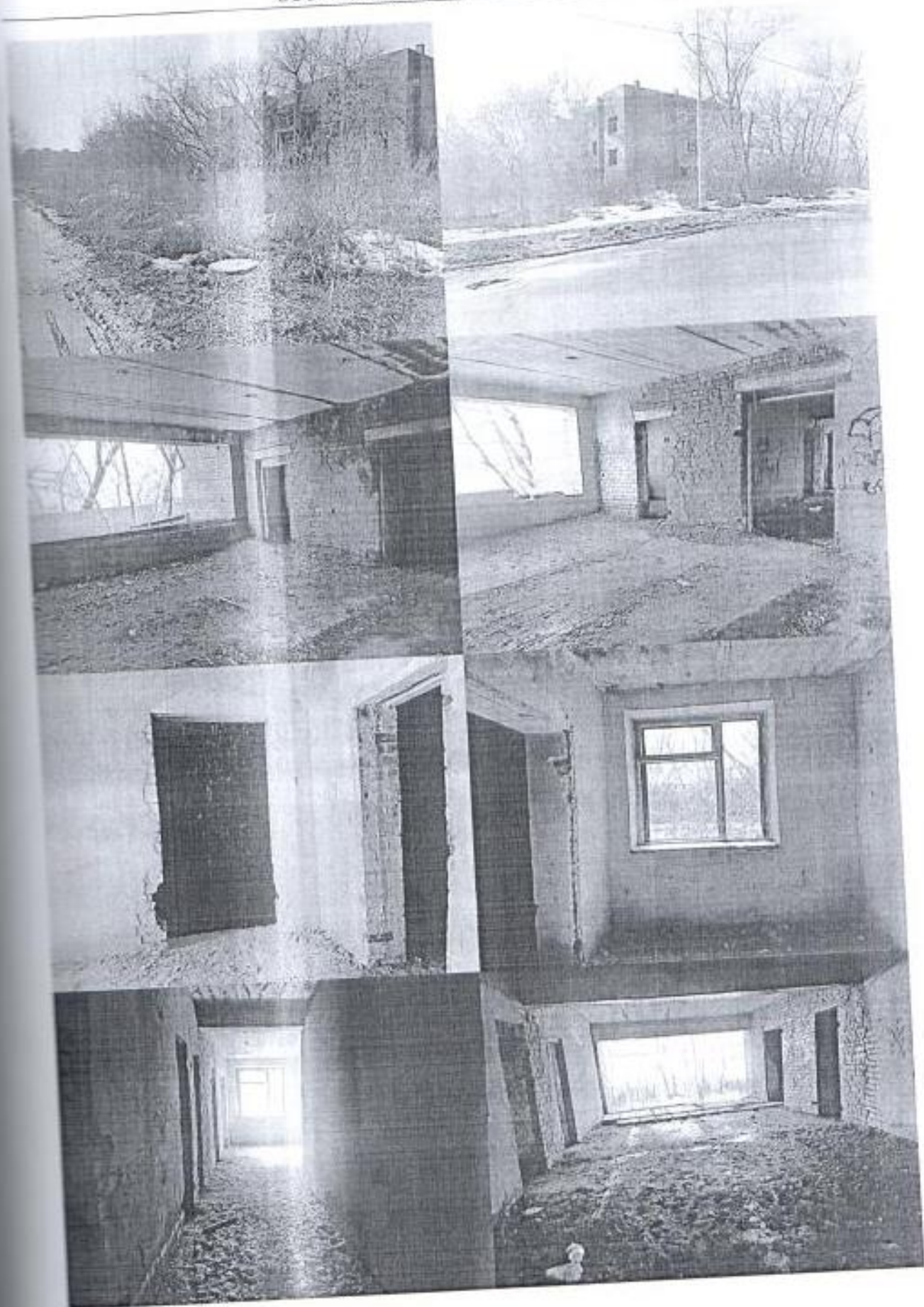
Фото сделаны 09.03.2023г.