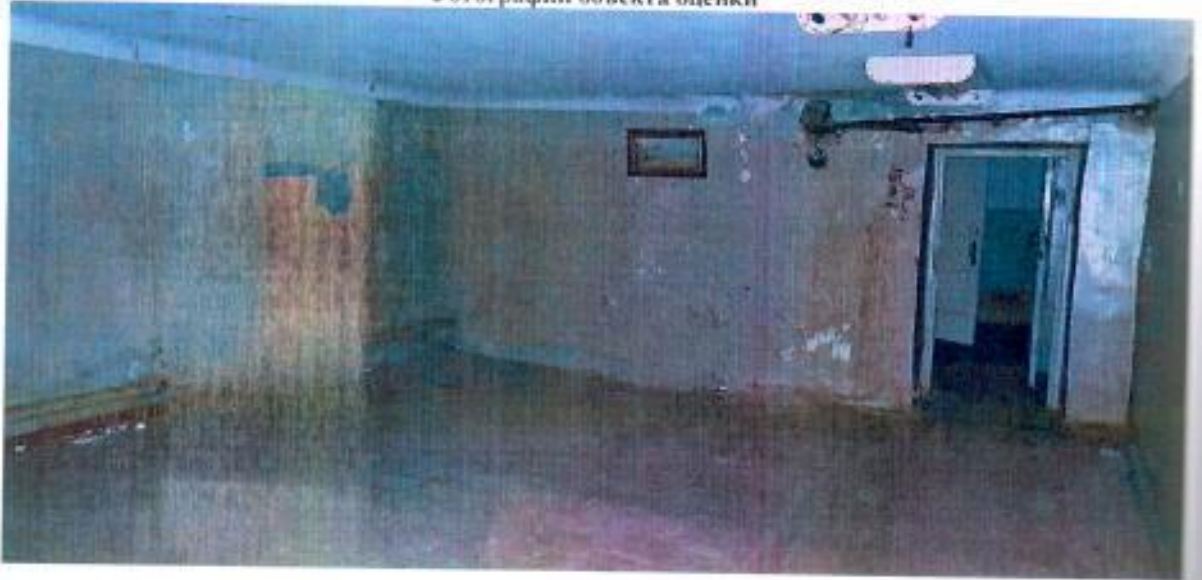
Фотографии объекта оценки