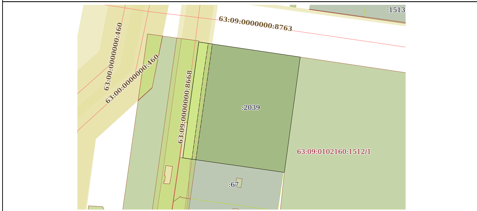
План (чертеж, схема) земельного участка