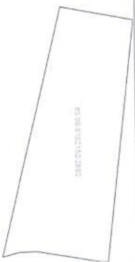
План (срезка, схема) земельного участка