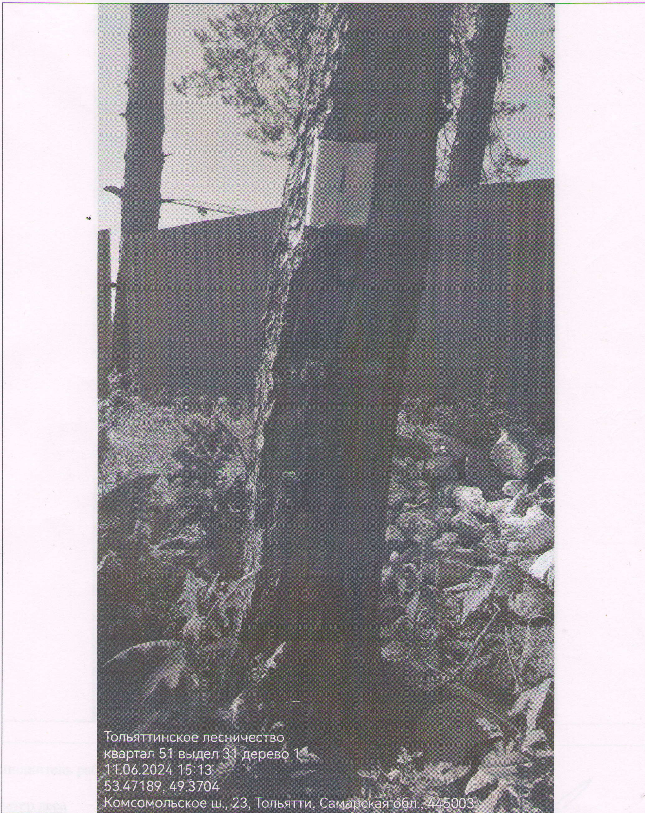
Тольяттинское лесничество квартал 51 выдел 31 дерево 1 11.06.2024 15:13 53.47189, 49.3704 Комсомольское ш., 23, Тольятти, Самарская обл., 445003