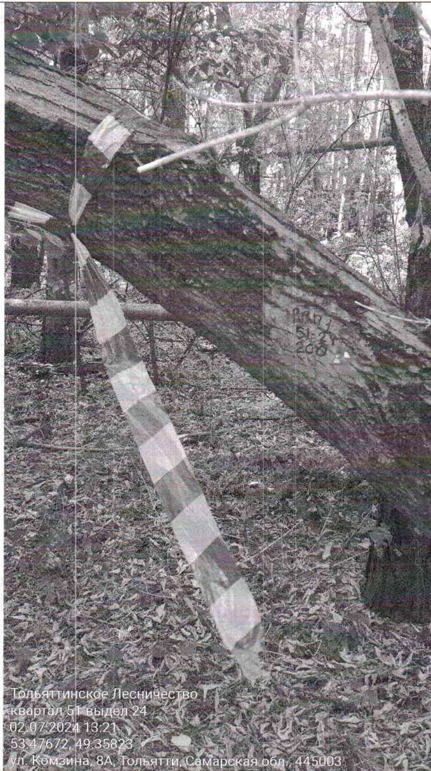
Тольяттинское Лесничество квартал 51 выдел 24 02.07.2024 13:21 53 47672, 49 35823 ул. Комзина, 8А, Тольятти, Самарская обл., 445003