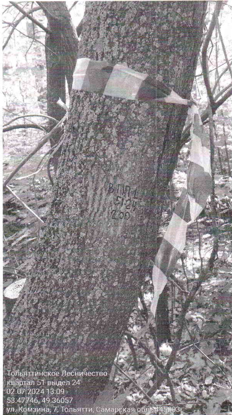
Тольяттинское Лесничество квартал 51 выдел 24 02.07.2024 13:09 53.47746, 49.36057 ул. Комзина, 7, Тольятти, Самарская обл., 445003