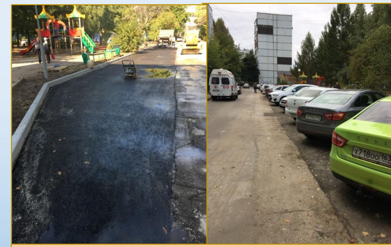
Фото объекта «После»