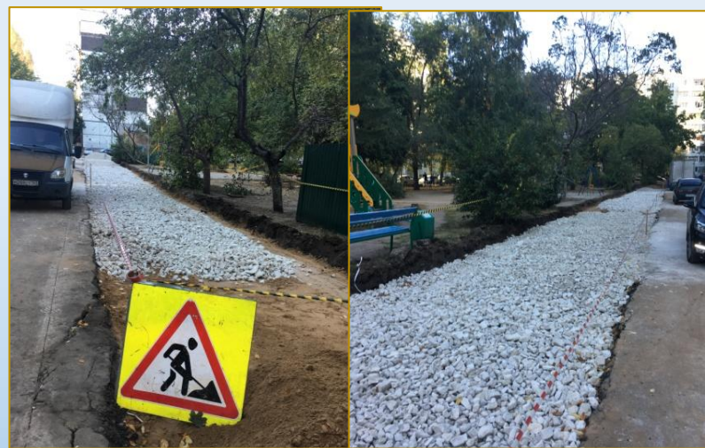
Фото объекта «В работе»