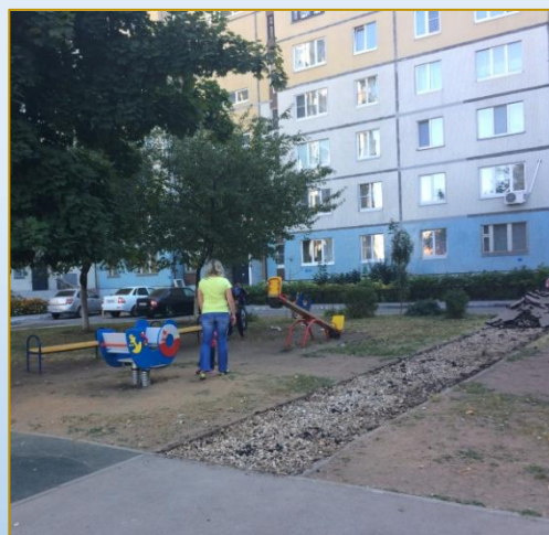
Фото объекта «В работе»