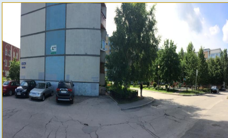
Фото объекта «До»