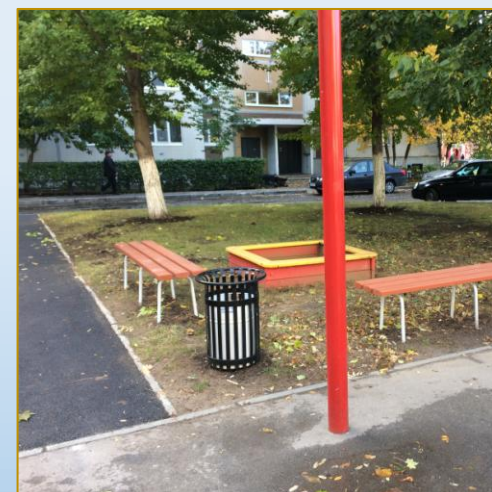
Фото объекта «После»