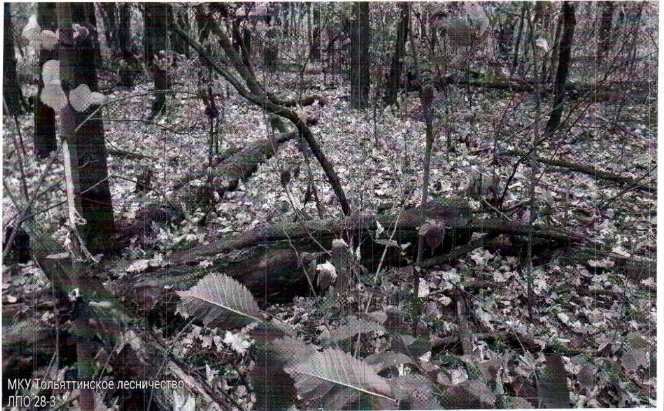
МКУ Тольяттинское лесничество ЛПО 28-3