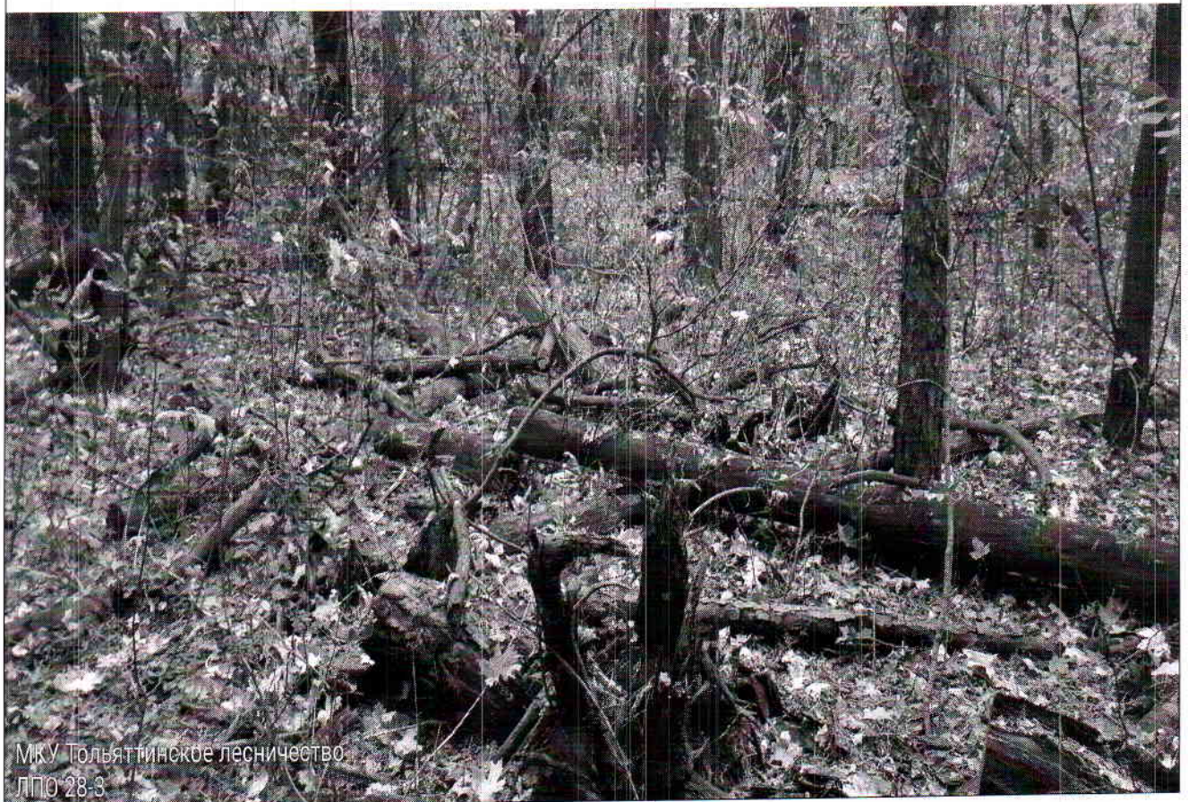
МКУ Тольяттинское лесничество ЛПО 28-3