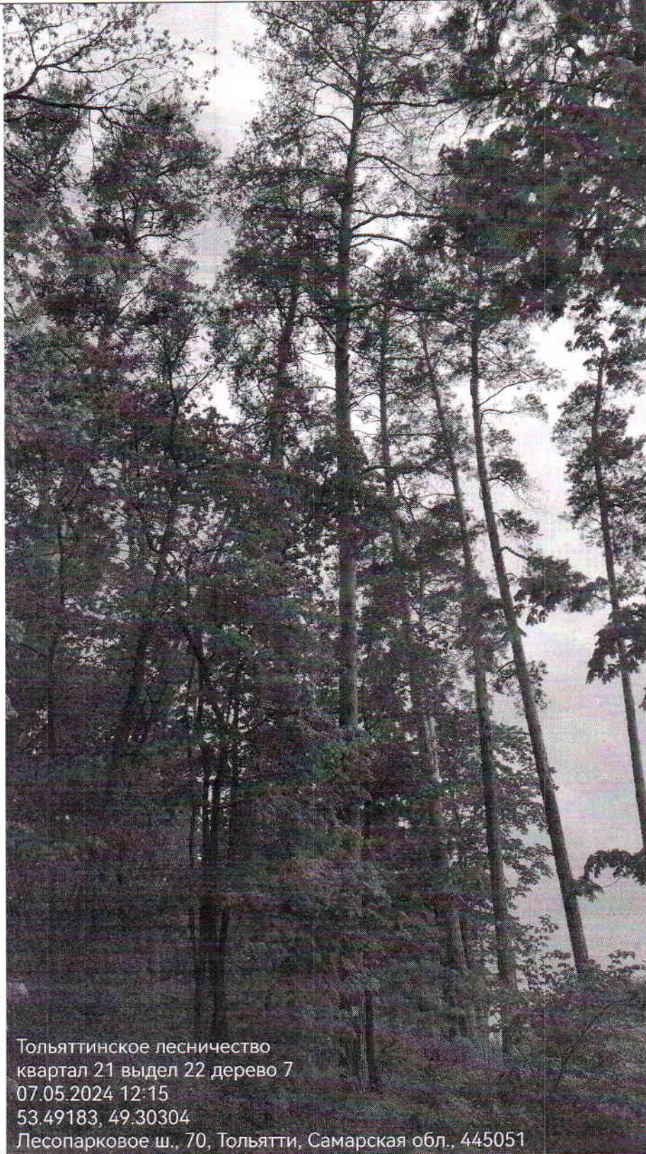
фото № 14

Тольяттинское лесничество квартал 21 выдел 22 дерево 7 07.05.2024 12:15 53.49183, 49.30304 Лесопарковое ш., 70, Тольятти, Самарская обл., 445051