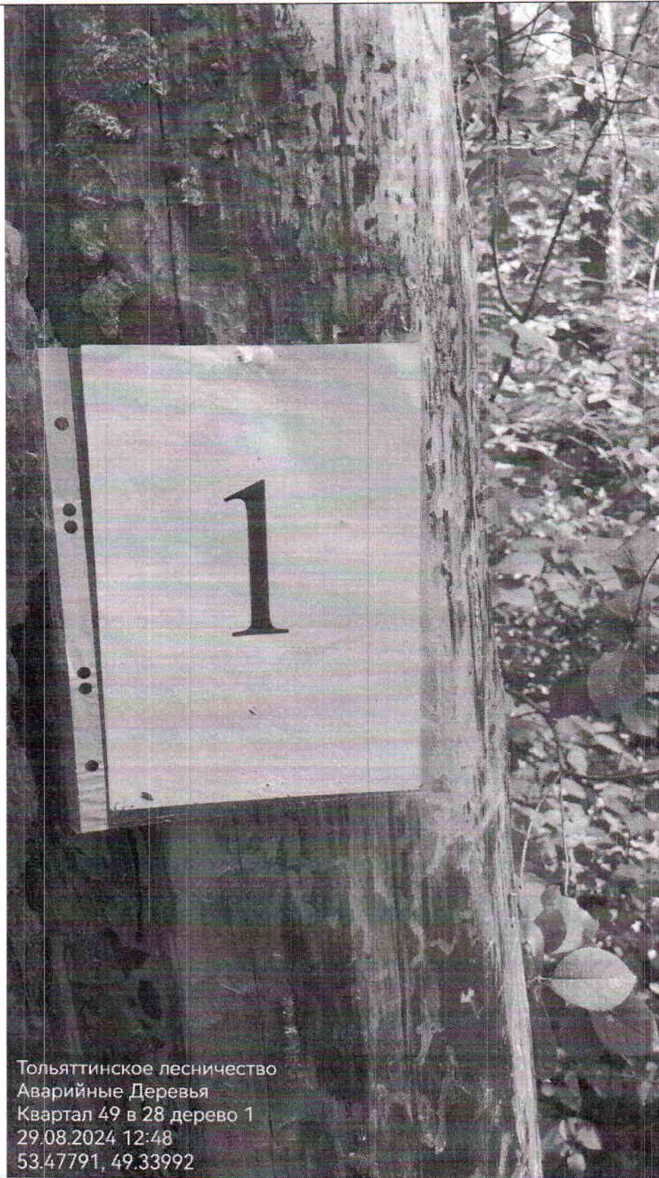
Тольяттинское лесничество Аварийные Деревья Квартал 49 в 28 дерево 1 29.08.2024 12:48 53.47791, 49.33992