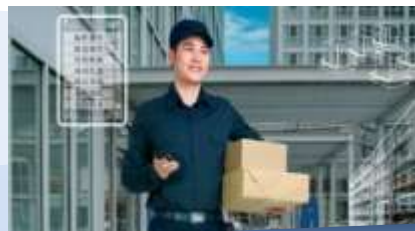
30采供服务体系 Easy Buying