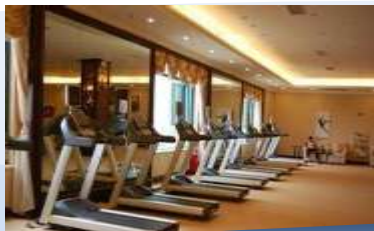
企业配套服务体系 Business Supporting