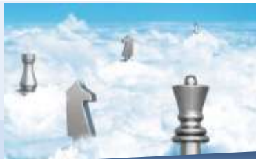
战略资源服务体系 strategic service