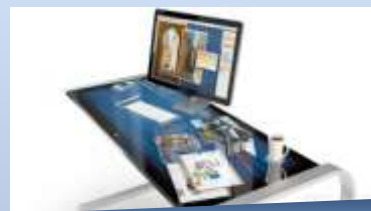
拎包入驻服务体系 One Stop