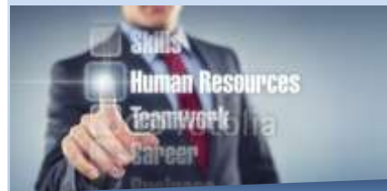
人才关爱服务体系 Talent Care