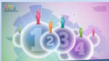
融资租赁服务体系 Finance Lease