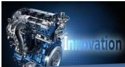
创新驱动服务体系 Innovation Driven