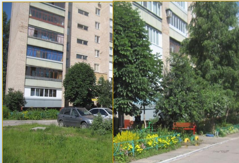
Фото объекта «До»