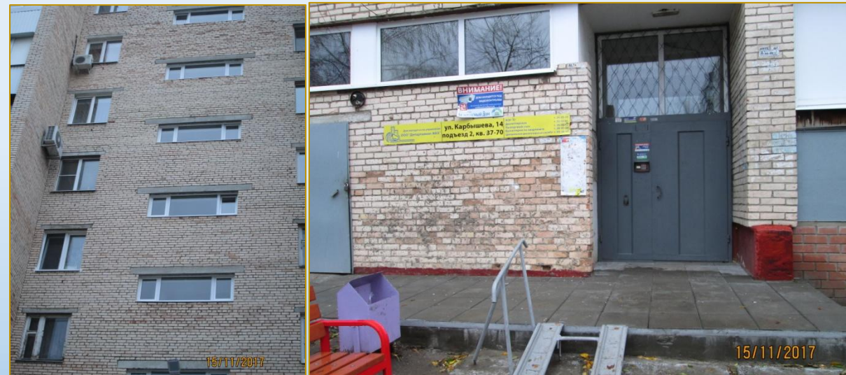
Фото объекта «После»