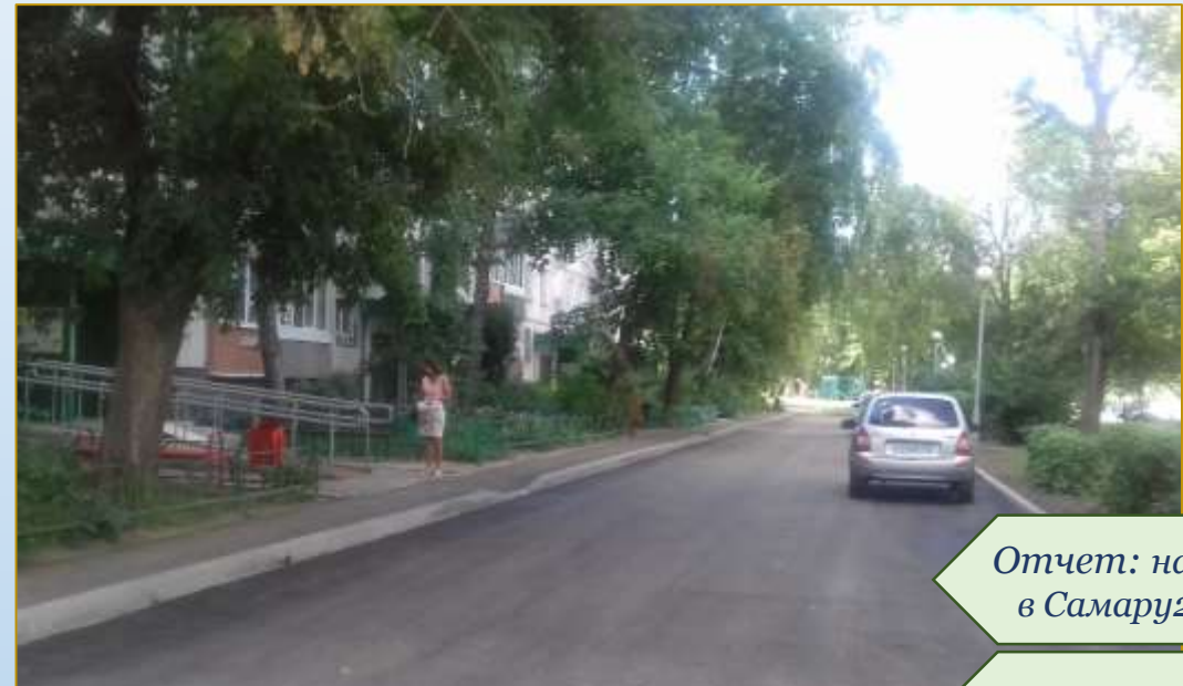
Фото объекта «После»