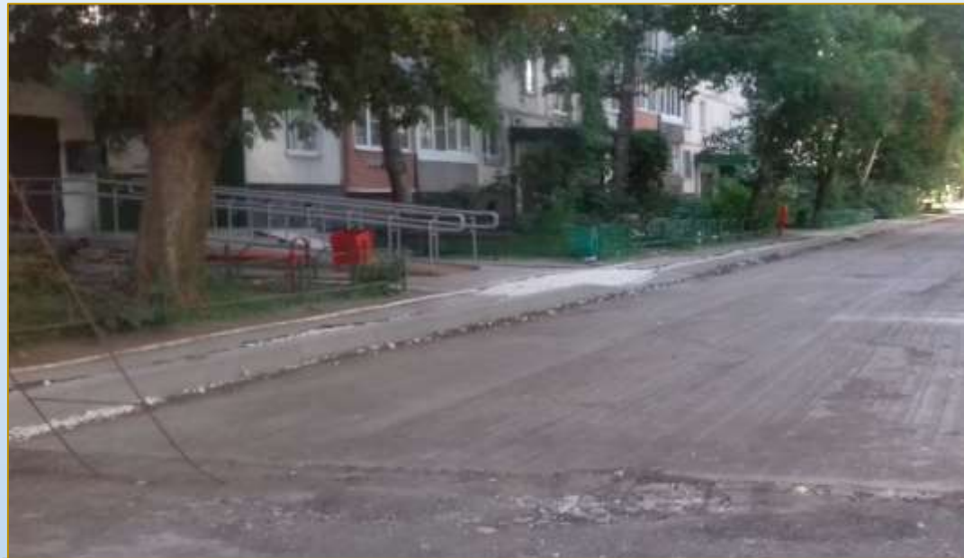
Фото объекта «В работе»