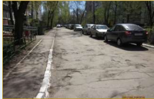
Фото объекта «До»