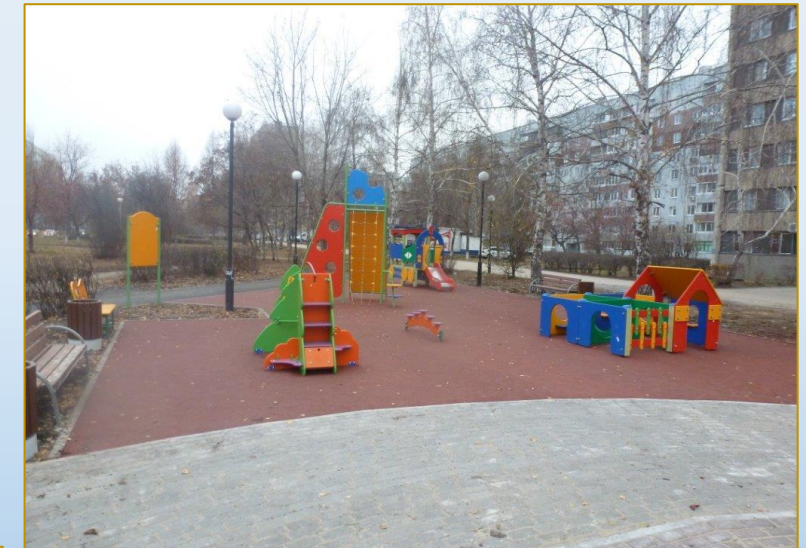
Фото объекта «После»