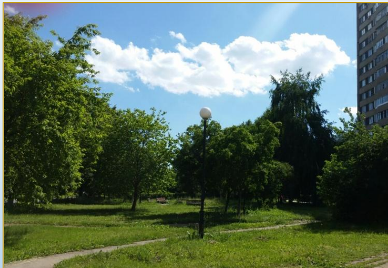
Фото объекта «До»