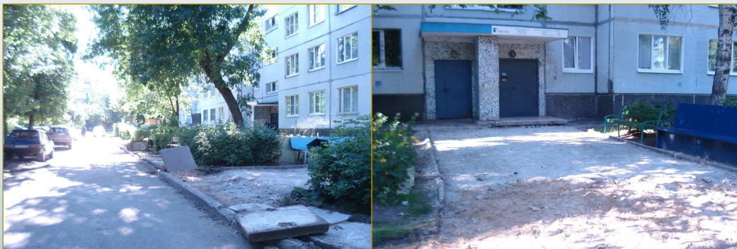
Фото объекта «В работе»