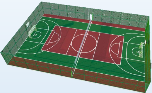
Произвольный вариант проекта