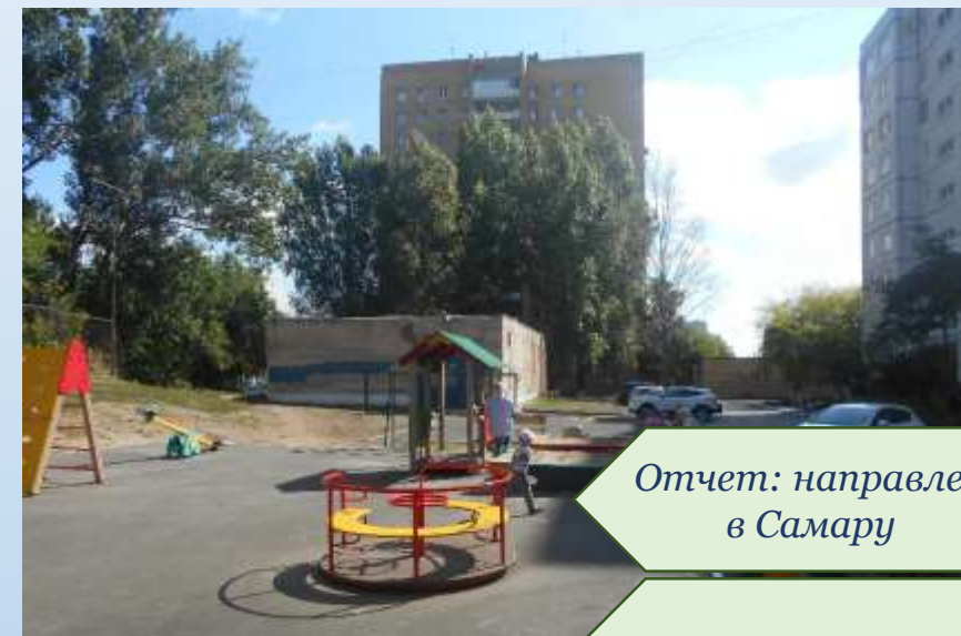
Фото объекта «После»