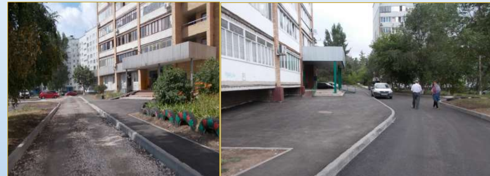
Фото объекта «В работе»