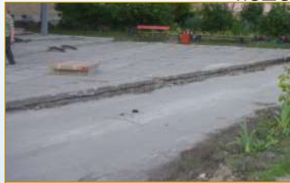
Фото объекта «До»