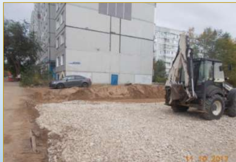
Фото объекта «В работе»