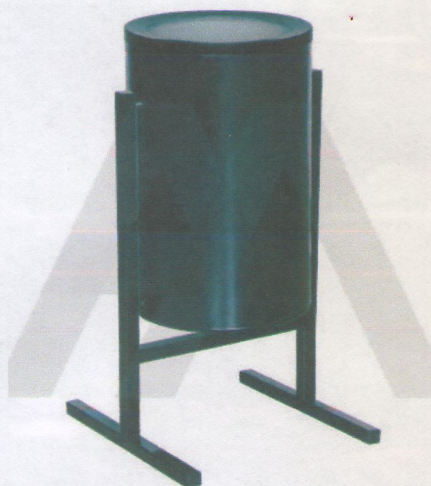
Урна ПЛ-160314 (1882р) (1шт.)