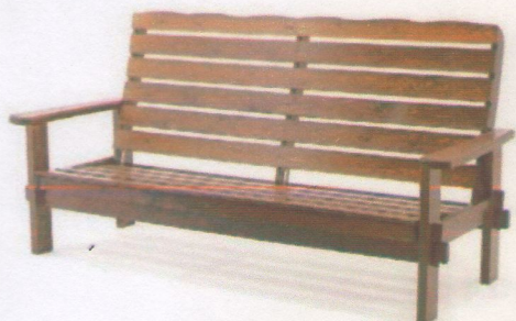
Садовый диван (5253р) (1шт.)