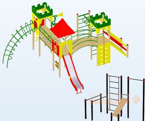
Произвольный вариант проекта