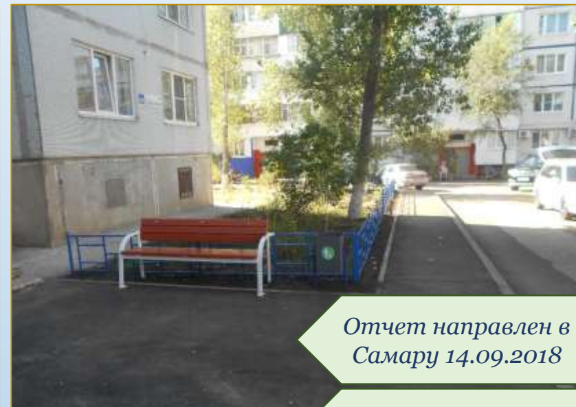
Фото объекта «После»