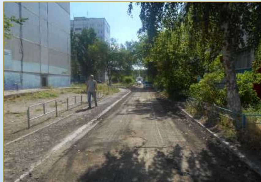
Фото объекта «В работе»