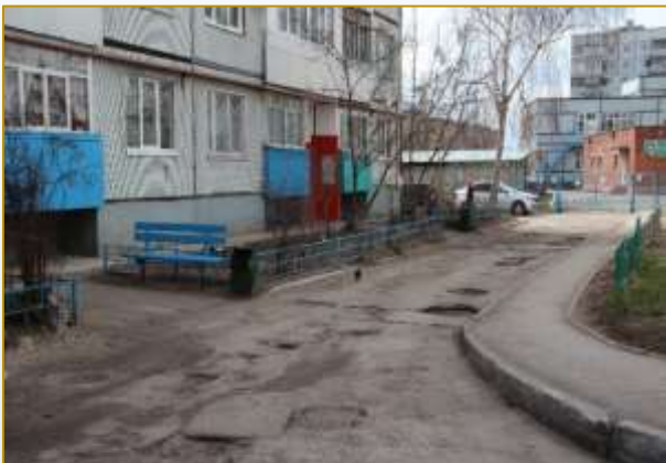
Фото объекта «До»