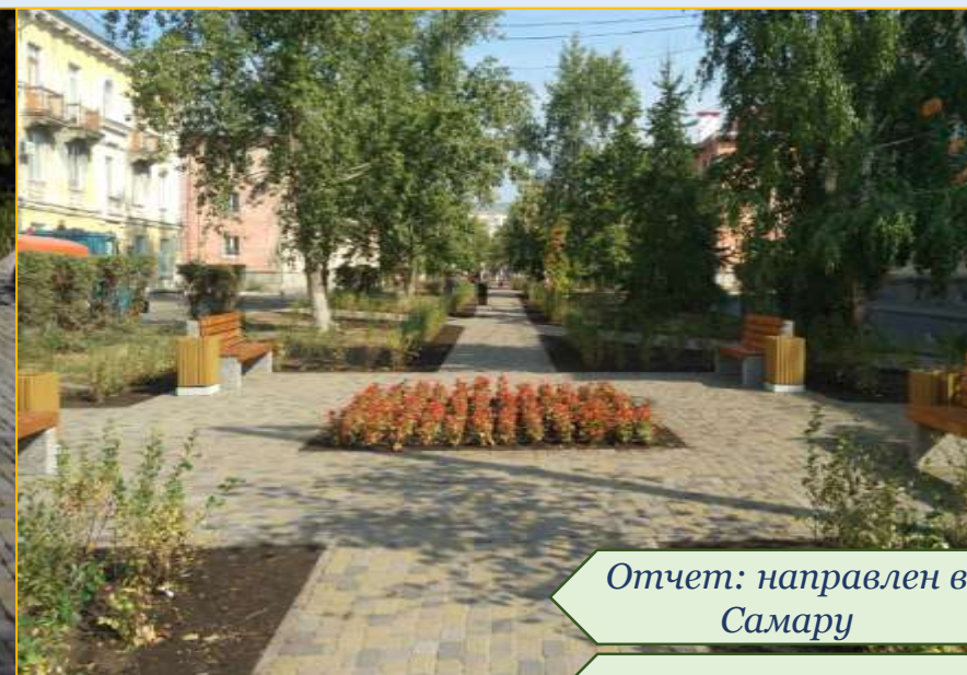
Фото объекта «В работе»