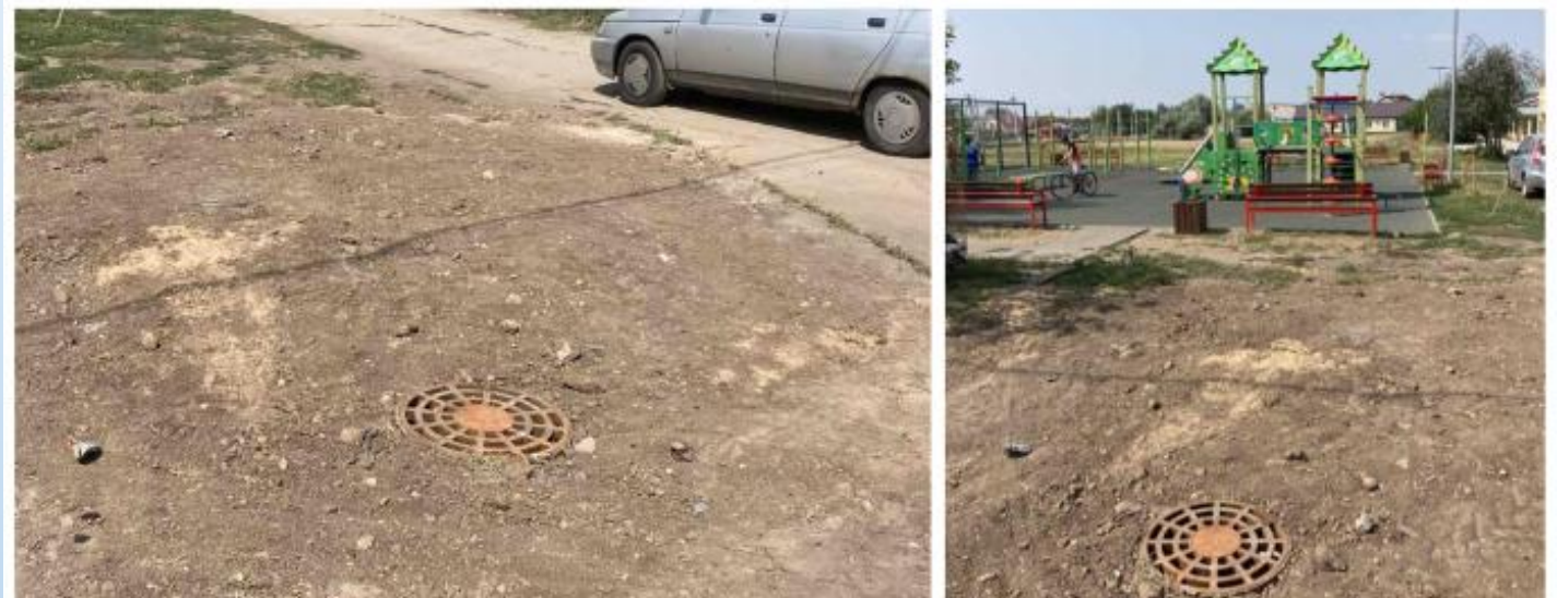
Фото объекта «После»