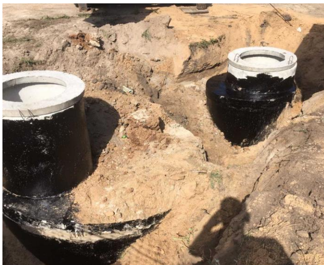
Фото объекта «В работе»