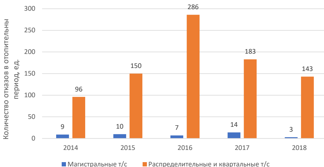
Рисунок 1 – Статистика отказов тепловых сетей эксплуатируемые филиалом «Самарский» ПАО «Т Плюс» в Центральном районе за отопительные периоды 2014-2018 гг.

Динамика отказов на тепловых сетях за отопительный и неотопительный период приведена в пункте 3.9 Главы 1 «Существующее положение в сфере производства, передачи и потребления тепловой энергии», а также в пункте 2 Главы 11 «Оценка надежности схемы теплоснабжения». Ниже приведены графики статистики отказов за ретроспективный период на тепловых сетях эксплуатируемых филиалом «Самарский» ПАО «Т Плюс» и АО «ТЕВИС». По представленным данным статистики отказов, повреждения на тепловых сетях не повлекли за собой прекращение теплоснабжения потребителей.