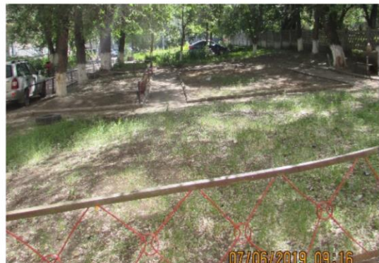
Фото объекта «До»