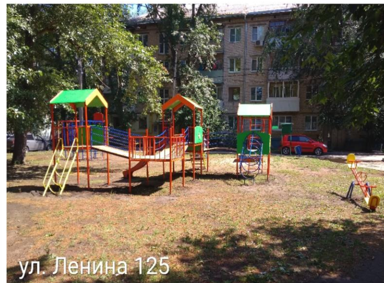
ул. Ленина 125