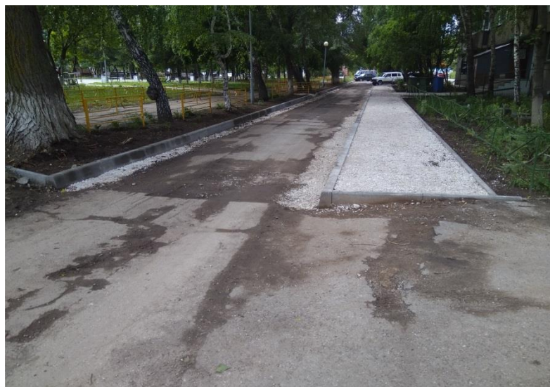
Фото объекта «В работе»