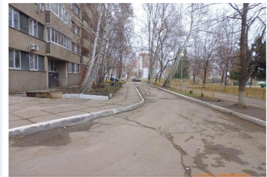
Фото объекта «До»

Общественный совет р-на: Плахова И.А. т.89171271683