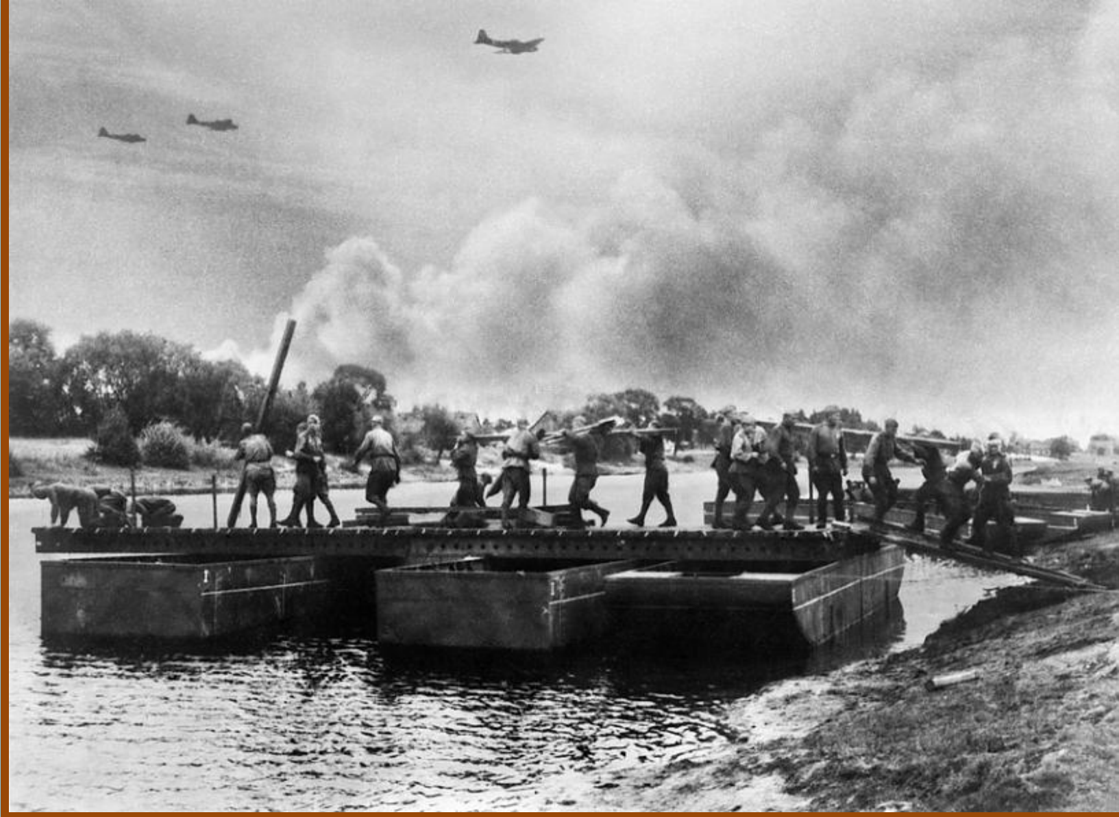
Саперы наводят понтонный мост через Нарев у Боровска. Сентябрь 1944 г.