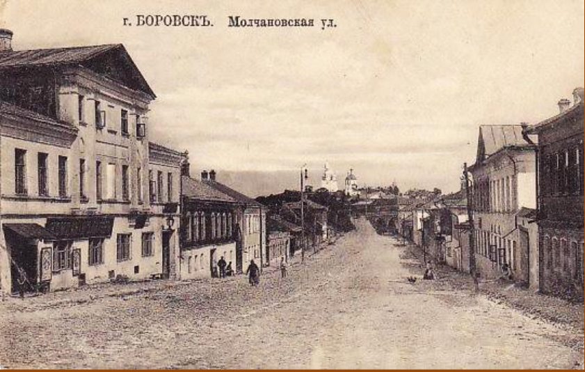
г. БОРОВСКЪ. Молчановская ул.