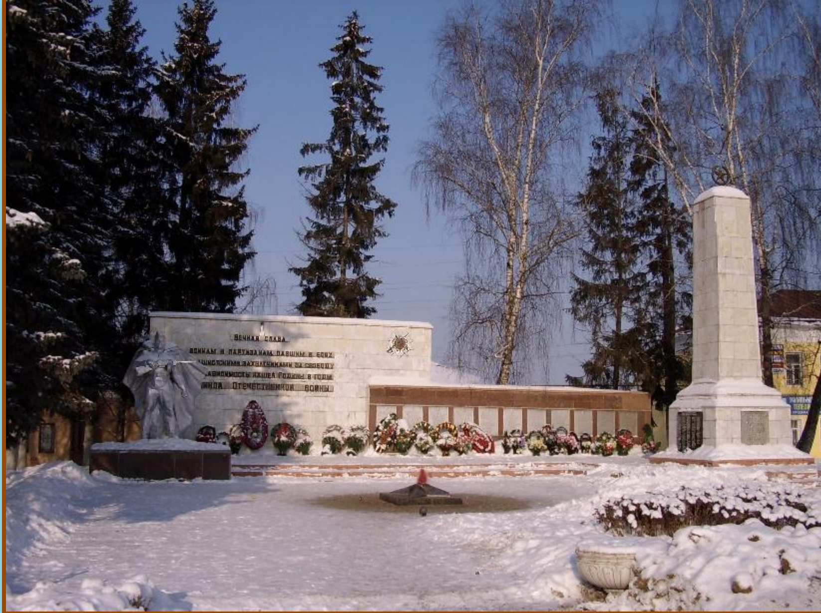
Воинский мемориал в Боровске.