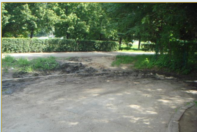
Фото объекта «До»