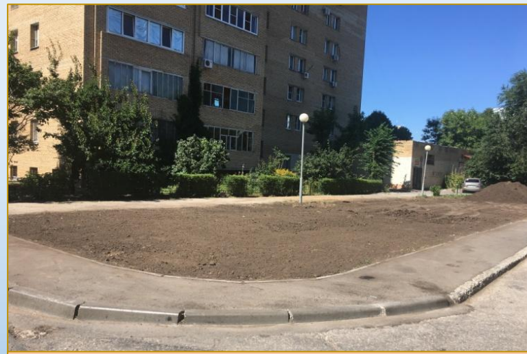
Фото объекта «В работе»