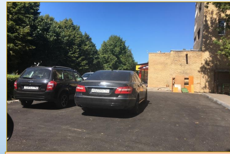
Фото объекта «После»