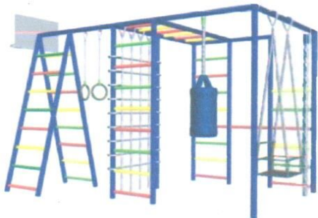
Спортивный комплекс №3 СО 3.12 (1шт.)