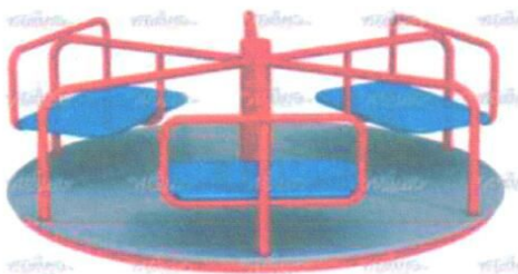
Карусель с 6-ю сидениями ДИО 2.01 (1шт.)