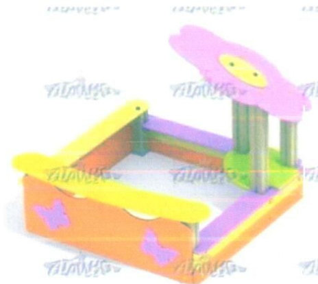
Песочница «Ромашка» МФ 3.03-16 (1шт.)