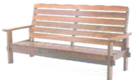
Садовый диван (5253р) (2шт.)