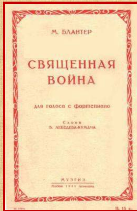
Партитура песни «Священная война»