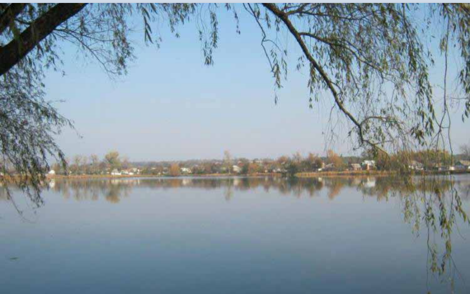
Город Шпола. Панорама