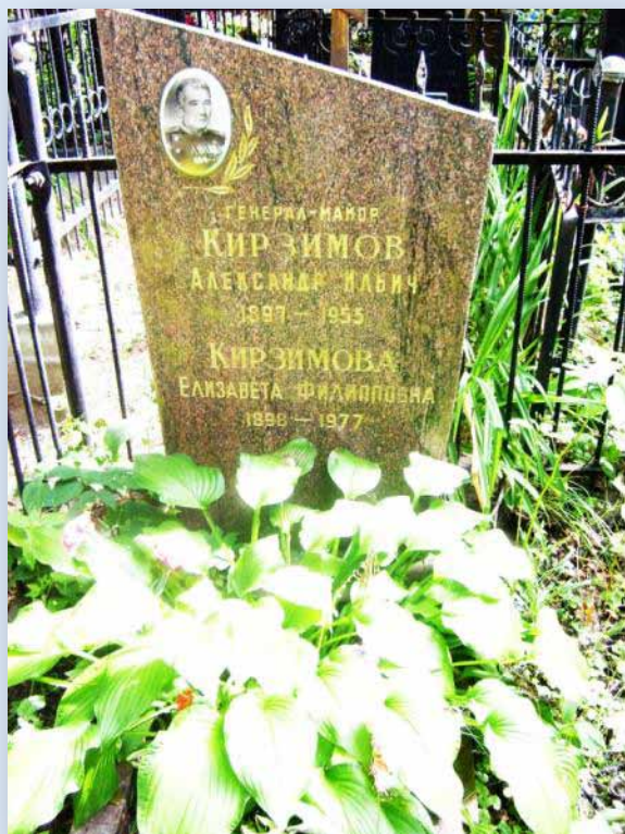
Могила генерала А.И. Кирзимова на Введенском кладбище.

8 декабря 1942 года вышел Приказ НКО СССР №00253 «О формировании десяти воздушно-десантных гвардейских дивизий». На базе 6-го воздушно-десантного корпуса сформирована 6-я Гвардейская воздушно-десантная дивизия. Дивизией командовал в 1942-1943 г. генерал-майор Александр Ильич Кирзимов.