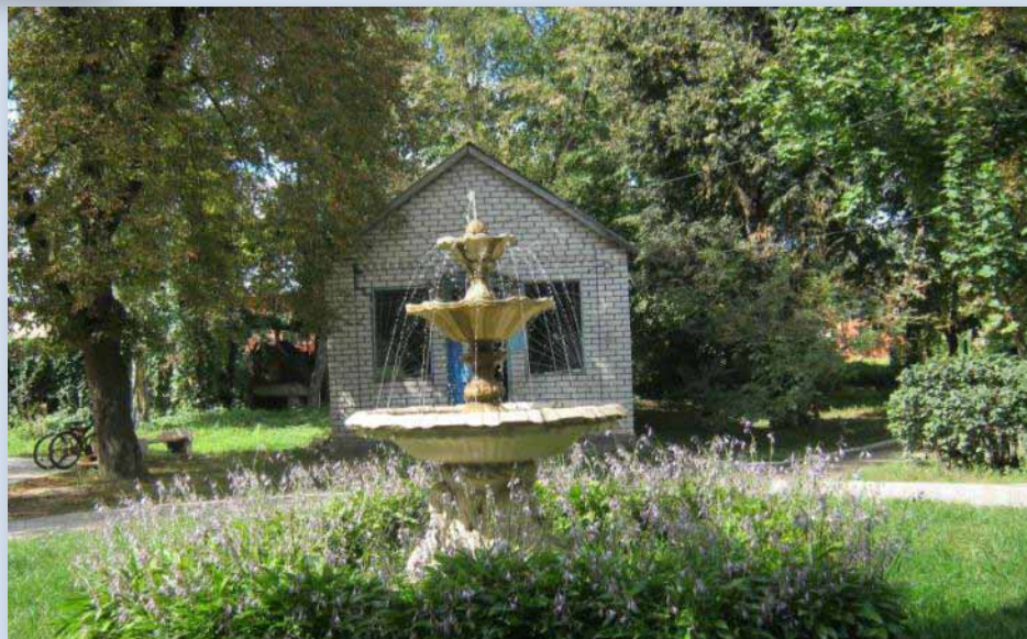
Город Шпола. Фонтан