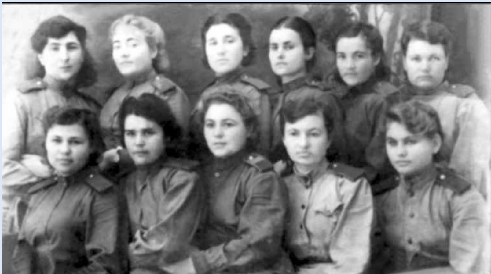
Девушки-добровольцы на курсах телефонисток в Подольске. 1941 г .