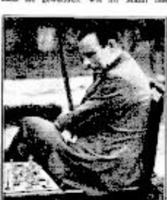
Manuskript des Kaiser (1927)