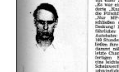
Manuskript des Kaiser (1927)