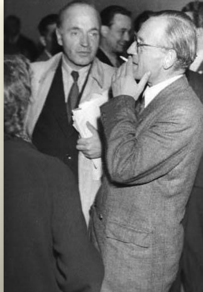
Государственный Секретарь ГДР Георг Дертингер