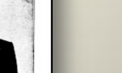
Manuskript des Kaiser (1927)