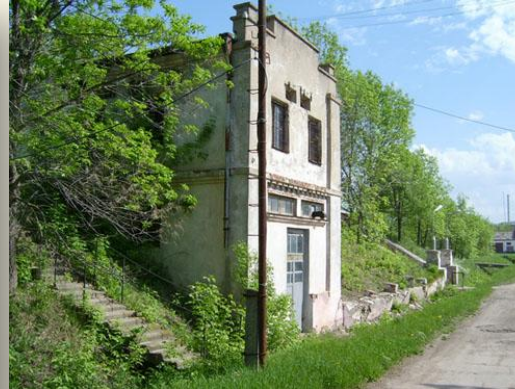
Радио ИККИ в Куйбышеве