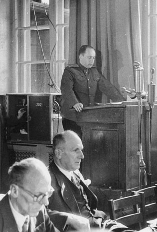
Советская военная администрация В Германии (СВАГ). 1945 г.