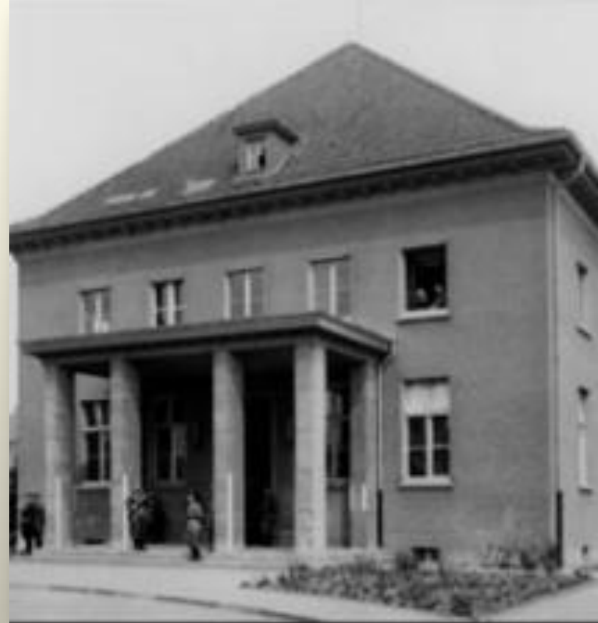
Здание советской военной Администрации в Германии