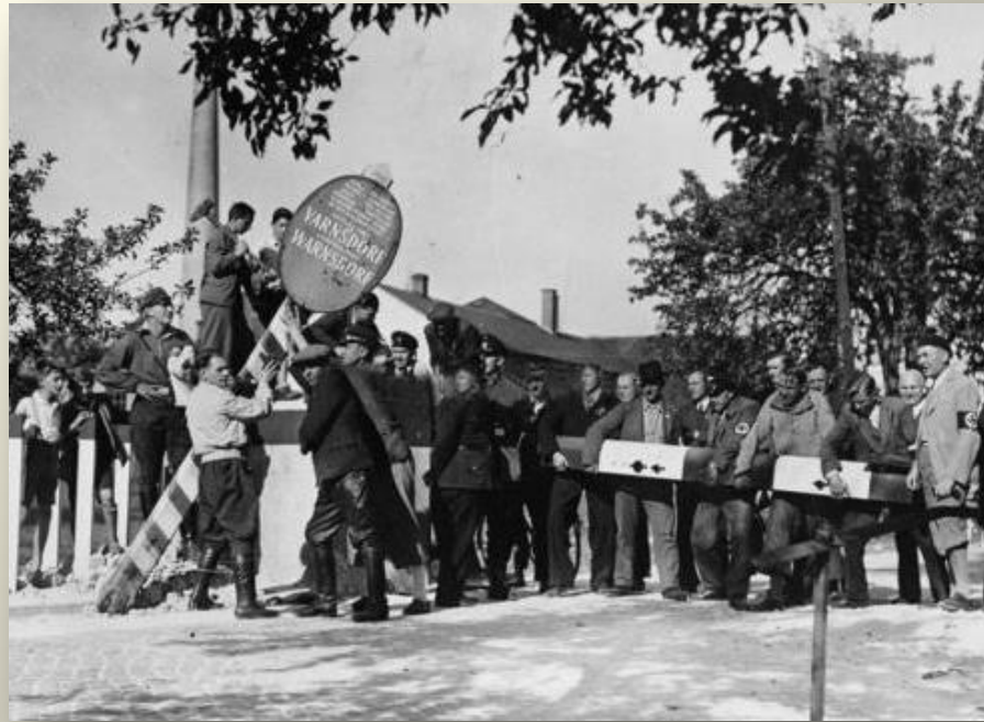
Германо-чешская граница. 1939