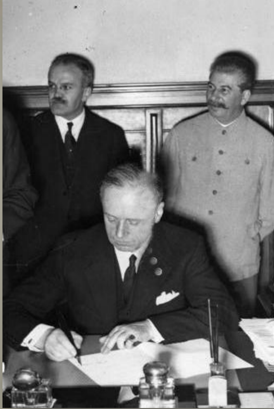
Риббентроп и Молотов подписывают договор. 1939