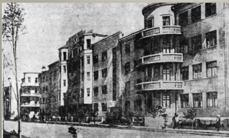
Здание МГБ в Куйбышеве