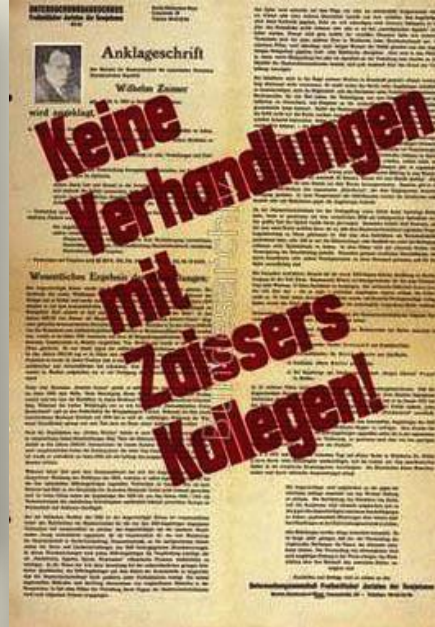
Статья о компании против министра госбезопасности Цайссера